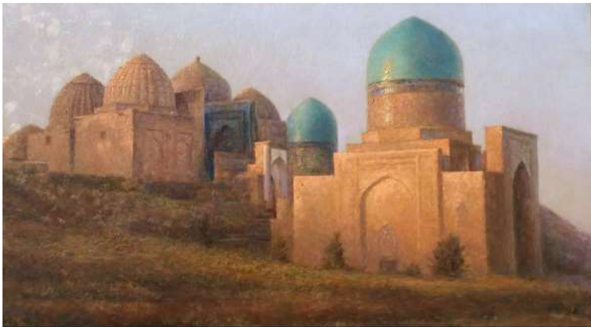
Рис. 5 Пример картины современного художника Петросова Геворга Олеговича.