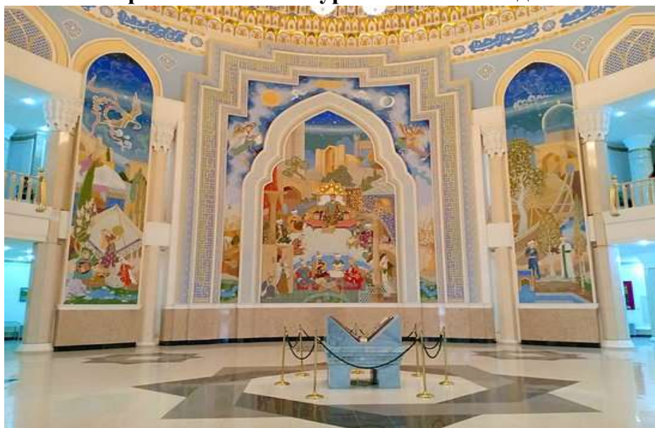
Рис 1. Пример исторического творчества Узбекистана - большое панно-миниатюра «Великий Темура – великий создатель»

Город Самарканд, расположенный в Узбекистане, еще с древних времен являлся не только центром традиций и культур, но также и одним из самых богатых источников вдохновения для большинства художников в самом широком понимании этого слова. Благодатная самаркандская земля хранит в себе огромное количество исторического художественного искусства, которое включает в себя великолепие согдийской коропластики, росписи дворца Афросиаба, живописные панно времен Амира Тимура, а также и колоритные произведения миниатюристов.