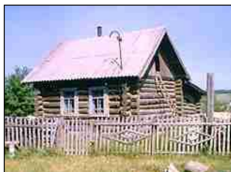
Четвертая станция –